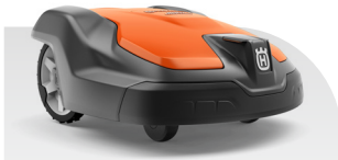
Automower® 520 EPOS®

Flächenleistung 2400/5000, Max. Steigung 45/15, Schnitthöhe 20-60, Gewicht 14,0