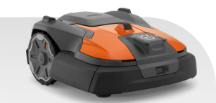
Automower® 580 EPOS®

Flächenleistung 8000/16000, Max. Steigung 45/20, Schnitthöhe 20-60, Gewicht 18,4