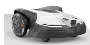
Automower® 450V NERA