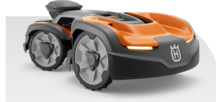
Automower® 535 AWD EPOS®

Flächenleistung 3500/6000, Max. Steigung 70/50, Schnitthöhe 30-70, Gewicht 17,0