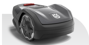
Automower® ASPIRE™ R4