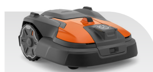
Automower® 540 EPOS®

Flächenleistung 4000/8000, Max. Steigung 50/20, Schnitthöhe 20-60, Gewicht 13,3