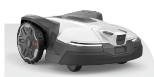
Automower® 430V NERA