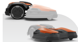
CEORA® 546 EPOS® + RZ 43M

Flächenleistung -/50000, Max. Steigung 20/15, Schnitthöhe 20-70, Gewicht 74,0