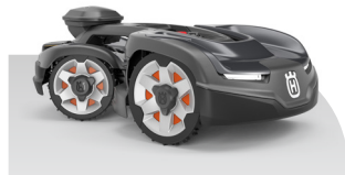
Automower® 435X AWD NERA