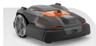
Automower® 580L EPOS®

Flächenleistung 8000/16000, Max. Steigung 45/20, Schnitthöhe 10-50, Gewicht 18,6