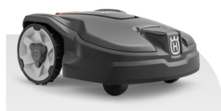
Automower® 315 MARK II