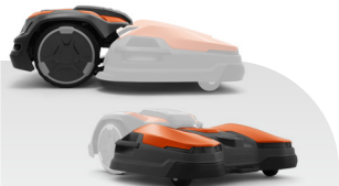
CEORA® 546 EPOS® + RZ 43L

Flächenleistung -/48000, Max. Steigung 20/15, Schnitthöhe 10-60, Gewicht 75,0