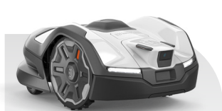
Automower® 405VE NERA