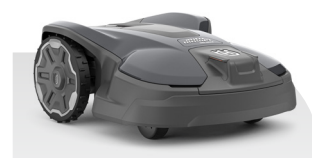
Automower® 320 NERA