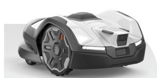
Automower® 410VE NERA