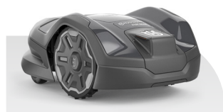
Automower® 310E NERA