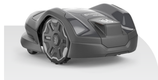
Automower® 305E NERA